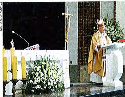
Kardynał Kazimierz Nycz przypomniał liczne zasługi świętego dla Warszawy