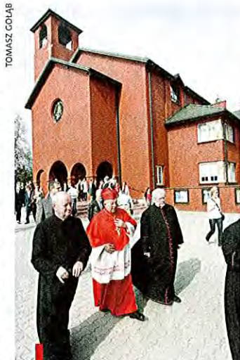
Przed dekadą kard. Józef Glemp erygował parafię św. Krzysztofa na Bielanach