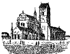
Kościół P. Maryi przed ostatnią restauracją.